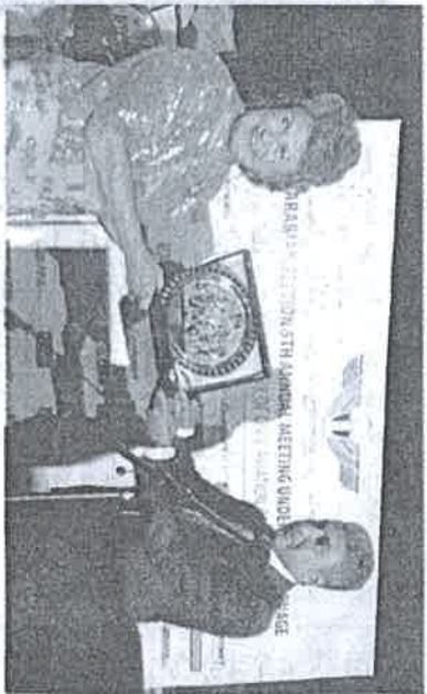
الوزير يكرم عائيا الطويل

واجتيازها بقوة وجدارة لا مثيل لهما، وأشادت تيمور إلى أن الحكومة المصرية اتخذت عام ٢٠١٧ عاما للمرأة المصرية، تقديرًا لجهودها وإنجازاتها، حيث إن الدولة المصرية تعمل على تشجيع دور المرأة في مختلف المجالات.