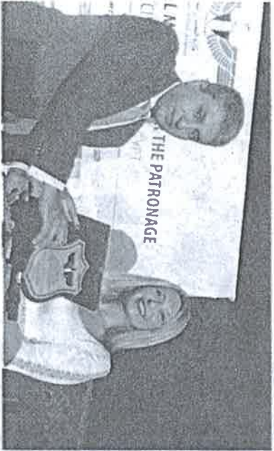
...وكرم جان مافزى