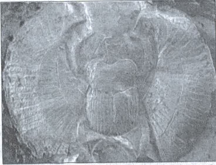
■ إحدى الرقائق الذهبية التي ستعرض