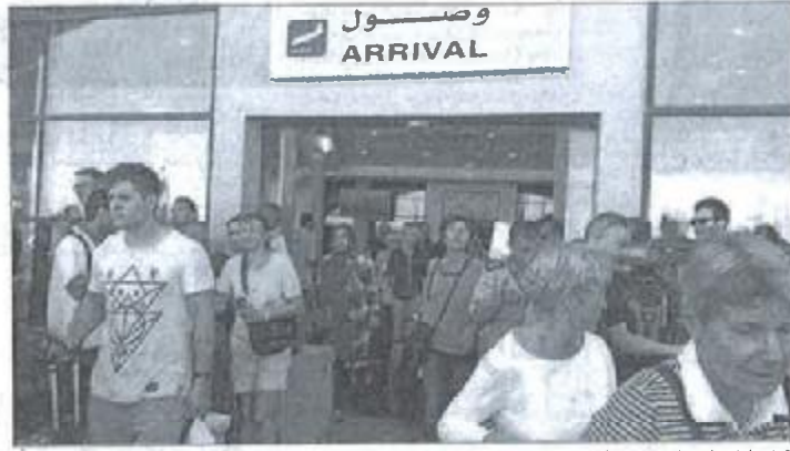
آمال وإمانات في قطاع السياحة لانتعاش وزيادة الوافدين في العام الجديد

وهؤلاء الذين معروفون بالاسم.. لكن لا نرى إلا بقعة أمام تلك الكارثة