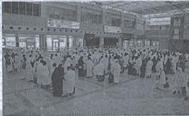
معمرون في طريقهم إلى الأراضي المقدسة، صورة أرشيفية.

وتابع «المهدي»، في الخطاب المرسل إلى غرفة شركات السياحة، أن الاختصاص بمقد جمعية عمومية غير عادية هو فقط لوزير السياحة، أو تلك عدد أعضاء الجمعية العمومية بموجب طلب كتابي مبينة به أسباب الدعوة إلى الاجتماع.