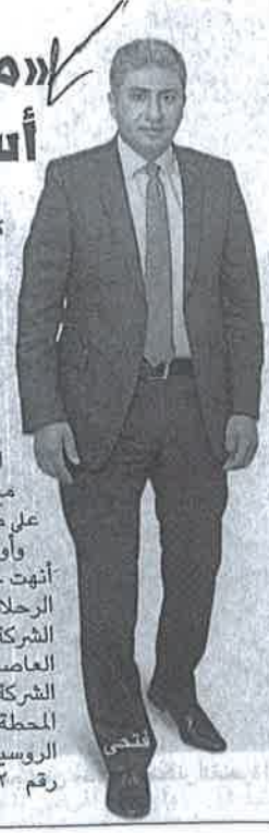
بن ن ٧ ٤ ٤

كتب - محمد الشيخ: كشفت مصادر بمصر للطيران، أن الشركة تعد حالياً جدول تشغيل خاصاً برحلاتها إلى روسيا، يتضمن تسيير ٣ رحلات أسبوعياً إلى العاصمة الروسية «موسكو»، ستُقلع جميعها من مطار القاهرة، بدءاً من فبراير المقبل، على أن تكون أولى الرحلات مع مطلع الشهر المقبل، بعد الحصول على موافقة سلطات الطيران الروسية. وأوضح المصدر أن «مصر للطيران» أنهت جميع الترتيبات الخاصة باستئناف الرحلات الجوية إلى روسيا، وسُرسلت الشركة أحد مديري محطة موسكو إلى العاصمة الروسية لإعادة فتح مكتب الشركة هناك والبدء في عمليات تشغيل المحطة. وكانت شركة «إيرفلوت» الروسية تسلمت مكتبها في مبنى الركاب رقم ٧ بمطار القاهرة، وانتهت من