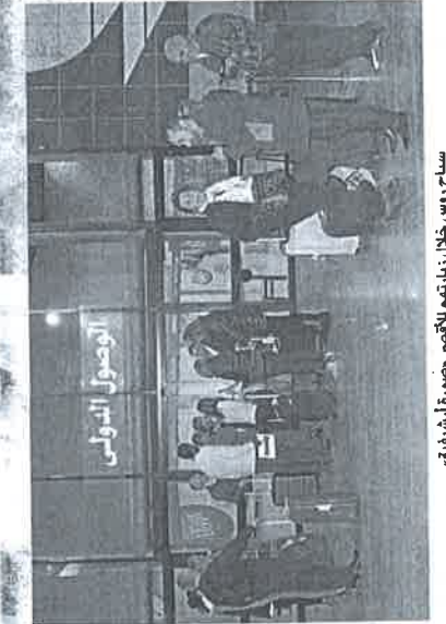
سياح روس خلال زيارتهم للأقصر -صورة أرشيفية-