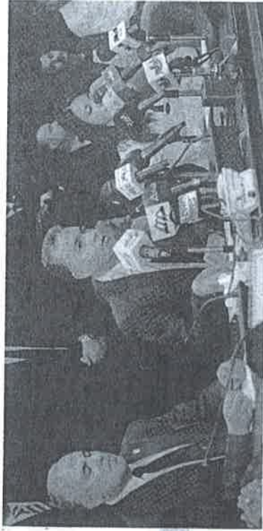
جانب من المؤتمر الصحفي الذى عقد عقب مراسم التوقيع

شهد الدكتور هشام عرفات وزير النقل والدكتور رانيا المشاط، وزيرة السياحة والدكتور محمد عبدالمطى وزير الري والموارد المائية واللواء مجدى حجازى محافظ أسوان مراسم التوقيع على عقد إدارة وتسيير خط النقل السياحي أسوان- حلفا، وتم توقيع العقد بين هيئة وادي النيل للملاحة النهرية وشركة فوجيا سور لونيبل الفرنسية المالكة للمائة السياحية لافلا نوزونيبل الذهبية. وصرح وزير النقل بأن هذا العقد يأتي فى إطار خطة تطوير هيئة وادي النيل للملاحة النهرية وإضافة أنشطة جديدة طبقاً لقرار إنشاء الهيئة، لافتاً إلى أنه لأول مرة يتم تشغيل عائمة سياحية من هذا الطراز على هذا الخط، حيث كان التشغيل سابقاً يمتد