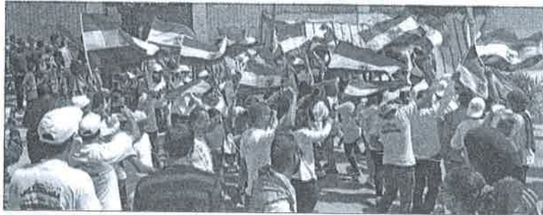
احتفالات المصريين وإقبالهم على الإنتخابات الرئاسية تأميد على وحدتهم لتحسن السياحة