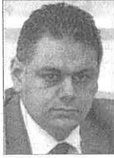
■ أحمد يوسف

تستطيع ان تمنح المقيمين بمجلس التعاون الخليجي التأشيرات مما يجعلها سببا في جذب الأنظار وزيادة الوافدين السياحيين إلى المقاصد المصرية. وأوضح انه في حالة نجاح المشاركين في بورصة دبي وجذب عدد أكبر من السياح العرب إلى المقاصد المصرية فإن هناك مشاكل كبيرة وكثيرة داخل مصر يجب مواجهتها وإيجاد حلول سريعة لها حتى تستطيع أن تحافظ أولا على السائح العربي المنبهر بالمقاصد المصرية وبالتالي تنجح في زيادة عددهم، اهم هذه المشاكل تحديد حد أدنى واقصى لجميع الفنادق الموجودة بالسوق المصرى. وعلى الجانب الاخر توقع المهندس أحمد يوسف، رئيس هيئة تنشيط السياحة، ارتفاع اعداد السياح الوافدين إلى مصر هذا العام بنسبة ١٠٪، مقارنة بعام ٢٠١٧، حيث بلغ عدد الوافدين ٨,٣ مليون سائح، موضعا أن الإيرادات السياحية بنهاية ٢٠١٨ يتحقق نسبة زيادة تتراوح ما بين ١٢ إلى ١٥٪ مقارنة بالعام الماضى.