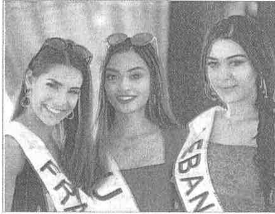
■ ملكات الجمال خلال مسابقة الفردقة