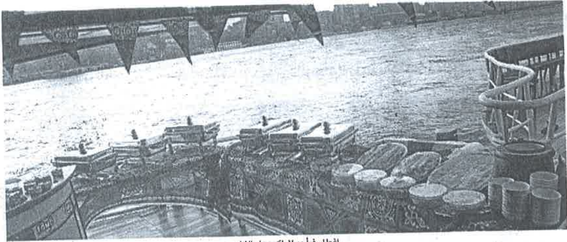
إفطار في أحد التراكب على النيل