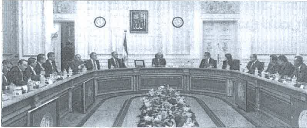
جانب من اجتماع رئيس مجلس الوزراء مع المستثمرين السياحيين بحضور وزيرة السياحة

رئيس الوزراء اقتنع تماما بالفكرة بل أبدى اهتمامه بسرعة تنفيذها.. وكلف وزير الري بالبدء فوراً في اختيار المنطقة الصالحة لإقامة هذا المرسى المنفذ لبدء التنفيذ.. فهل يستمر التأؤل بال «نيو لوك» الجديد للتعاون بين الحكومة والمستثمرين بصناعة الأعمال.. أم تتضمن تلك الفكرة المعاصرة للكثير من الأفكار التي دخلت غرفة الإنعاش ولم تخرج إلا لتنتظر.