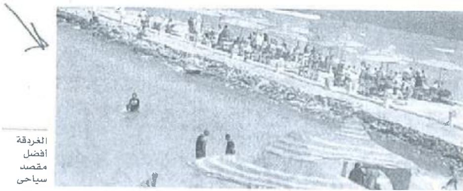
الغردقة أفضل مقصد سياحي