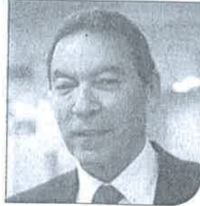
د. هاني الناظر

وذلك وفقاً لتصريحات منظمة الصحة العالمية، بأن مصر مؤخراً أصبحت الأولى في علاج فيروس سي والأرخص مادياً، بالإضافة إلى النوع البيئي الذي تتميز به في علاج الأمراض الجلدية وآلام المفاصل.