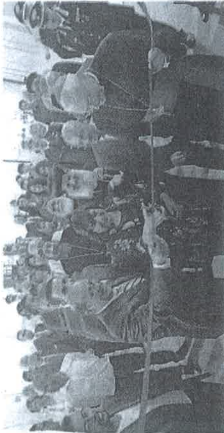
وزير الثقافة أثناء افتتاح المعرض

الإيطاليين خلال حفل الافتتاح لزيارة مصر مهد الحضارات وملاذ العائلة المقدسة لمشاهدة ما تزخر به من تنوع ثقافي وحضاري فريد وهو ما يعد أفضل دعاية لمسار الرحلة في مصر وسيعمل على زيادة الأفواج السياحية