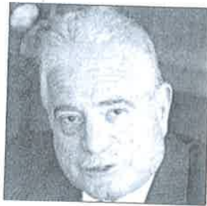
■ خالد فودة

احتفلت طابا هايتس باستقبال مطار طابا لأولى رحلات شركة الإسكندرية للطيران كأول خطوط جوية تعود لتسيير رحلات مطار طابا وهي الخطوة الهامة لتنشيط السياحة بالمدينة الساحرة وعودة الحياة الطبيعية لها والتي جاءت لتكفل جهود السيد اللواء خالد فودة محافظ جنوب سيناء والأجهزة الامنية السيادية لإعادة الحركة السياحية للمدينة.