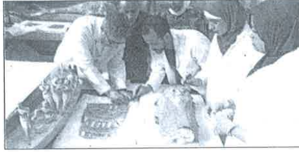
■ الخبراء خلال ترميم إحدى القطع الأثرية