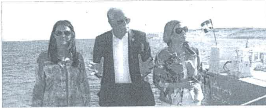
■ وزيرتنا السياحة والبيئة مع محافظ جنوب سيناء خلال جولتهم في رأس محمد

بعد أن نشرت سياحة وسفر الأسبوع الماضي تقريرا تحت عنوان: هل تنجح الحكومة في تشجيع السياحة البيئية؟ وتضمن الغضب الذي انتاب حفيفة عدد من المستثمرين السياحيين بسبب التصريحات التي أثارها وزارة البيئة من الجهود المبذولة لرفع كفاءة السياحة البيئية بالفيوم، وأكدوا أنه كلام مرسل وغير واقعي، خاصة أن الفيوم ليست من المدن السياحية.. توجت دياسمين فؤاد وزيرة البيئة، ود رانيا المشاط وزيرة السياحة، إلى مدينة شرم الشيخ لحضور فعاليات الاجتماعات السنوية للتجمع الأفريقي للبنك الدولي وصندوق النقد الدولي وقامت بجولة تفقدية بحرية على ظهر مركب برفقة اللواء خالد فودة محافظ جنوب سيناء، في محمية رأس محمد بحرا وبراء، لوضع الخطوط العريضة لتطوير السياحة البيئية وتطوير المحميات الطبيعية في محافظة جنوب سيناء بشكل عام.. وقامت بتفقد بحيرة الأكسدة وعقد اجتماع مع العاملين لمناقشة مطالبهم والمشكلات التي